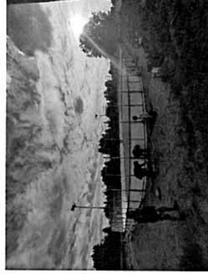
Kuva 5. valmis kaukalo