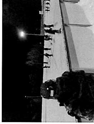
Kuva 2. Päätyverkot asennettuna, käynnissä luistelurieha