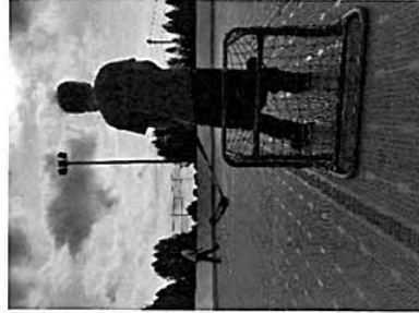
Kuva 5. valmis kaukalo