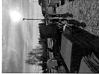
Kuva 3. Alustojen siirtoa