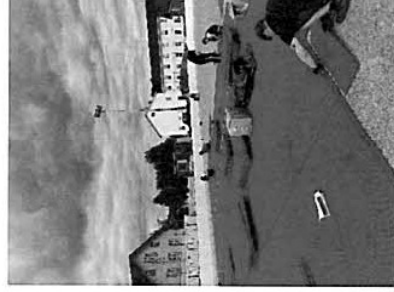
Kuva 4. kaukalon asennusta.