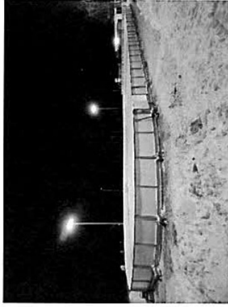
Kuva 1. Kaukalo marraskuussa 2021

Kesällä 2022 kaukalon pohjaa tasoitettiin talven jäljiltä ja pohjalle asennettiin kaukalon alustaksi tuleva pelimatto. Laitoja nostamalla saatiin onnistuneesti asennettua matto myös laitojen alle asennusohjeen mukaisesti. Koko projekti oli valmis elokuun ensimmäisellä viikolla.