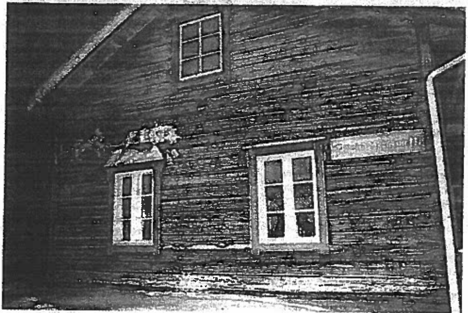
Riipin Matin pirtti on vanha Haapalan pirtti, joka on siirretty Riipiin Syväjärven ja Seipäjärven välisestä kairasta.